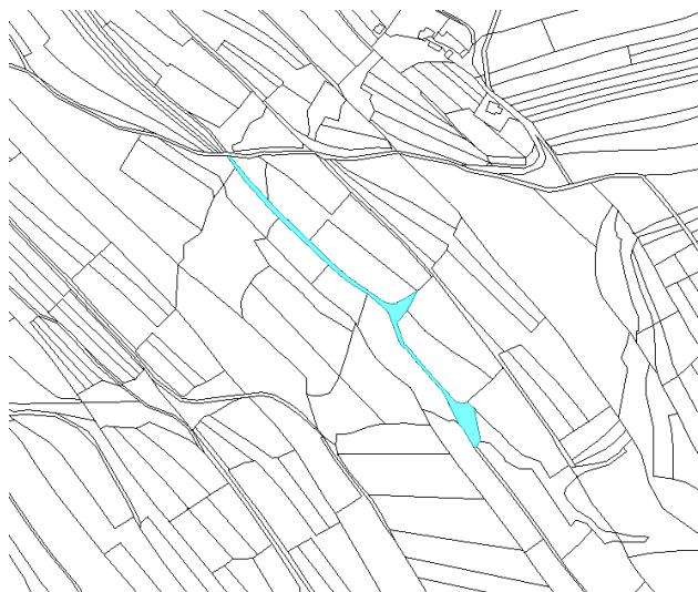
Horní Lideč LV 1065